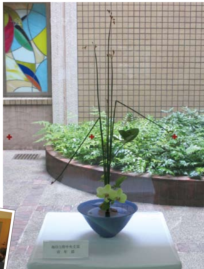
池坊玉野中央支部青年部の作品(1階玄関待合ロビー前にて撮影)